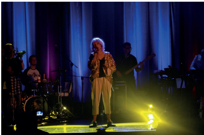
Koncert Meli Koteluk w emgok-u, 11 października

Niedawno do naszej gminy zawitała kolejna wschodząca gwiazda polskiej estrady – piękna, utalentowana i oryginalna Mela Koteluk. Piosenkarka ta odnosi sukcesy na listach przebojów takich stacji jak Radiowa Trójka, gdzie jej utwory stale plasują się wśród faworytów.