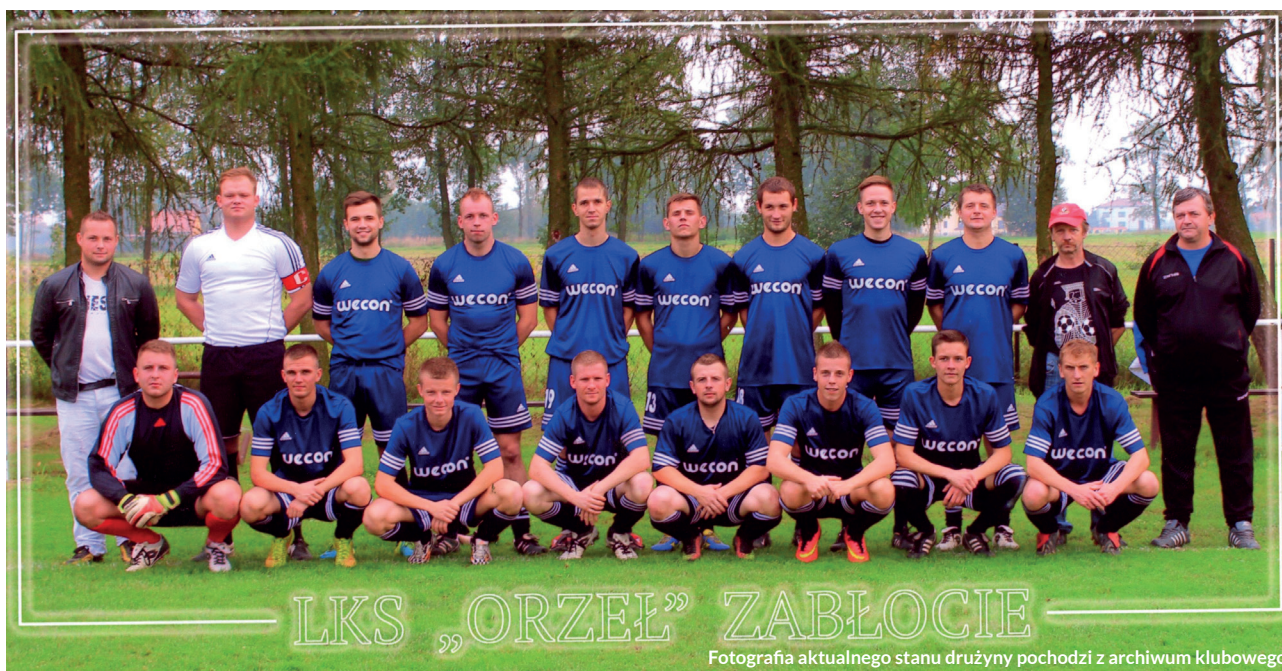
LKS „ORZEŁ” ZABŁOCIE